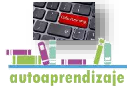
Y DESARROLLO DE COMPETENCIAS CONDUCTUALES