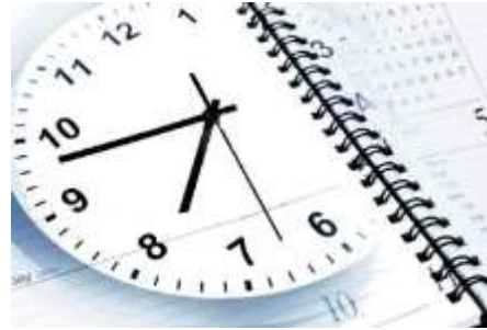
FLEXIBILIDAD DE HORARIOS