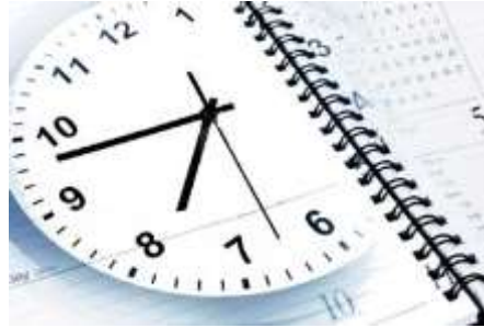
FLEXIBILIDAD DE HORARIOS