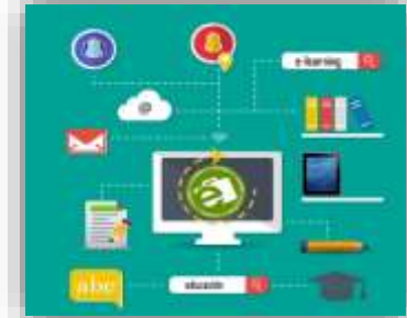
DESARROLLO DE COMPETENCIAS DIGITALES