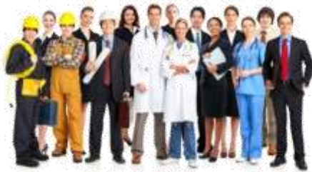
GENERACION DE NUEVOS EMPLEOS ESPECIALIZADOS